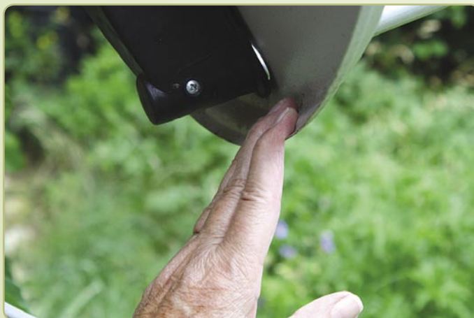
■ (Figura 4) Regolazione dell'Antenna di Lato

- Manuale d'uso solo in inglese Movimento massimo del motore di 60 gradi est/ovest