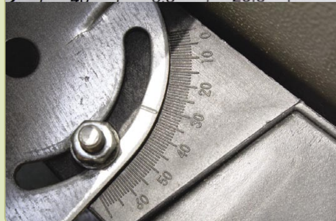
■ (Figura 3) Estratto della Tavola e Scala di Declinazione dell'Antenna