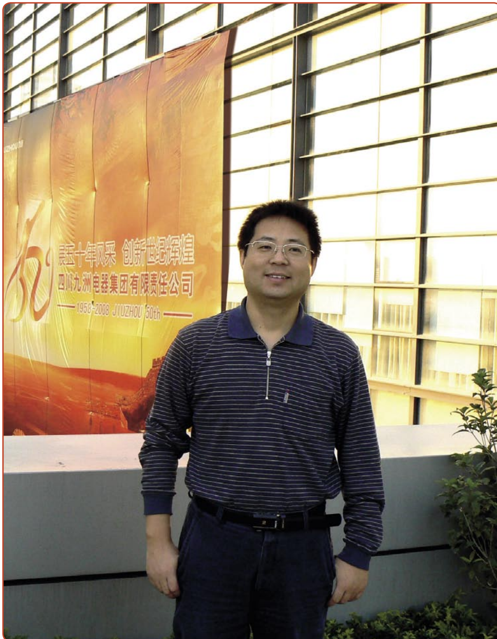
■ Il direttore marketing Overseas del Gruppo Jiuzhou nella veranda verde dell'edificio della Jiuzhou Electric. L'enorme poster sullo sfondo celebra il 50° anniversario della Jiuzhou.

Mentre questo era un ricevitore per definizione standard, il direttore del-