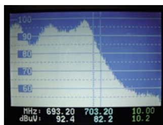
Misurazione rolloff del filtro

Durante i nostri test abbiamo osservato che non c'erano messaggi di corto-circuito quando il misuratore si trovava nella visione dell'analizzatore di spettro e avevamo intenzionalmente corto-circuitato il cavo di ingresso.