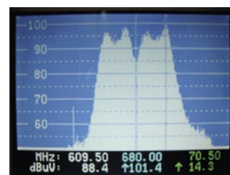
Misurazione l'increspatura del passa-banda